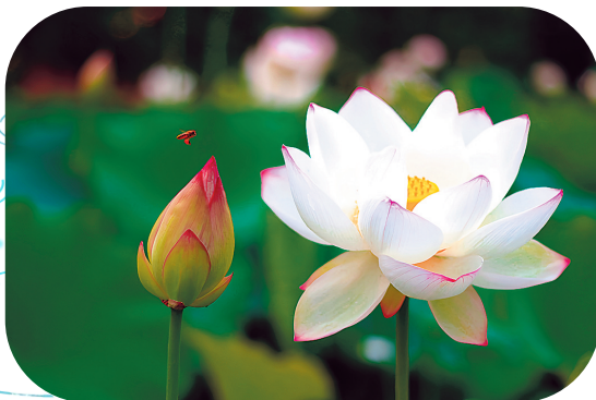
私语 遵义铝业 吴光旭 摄