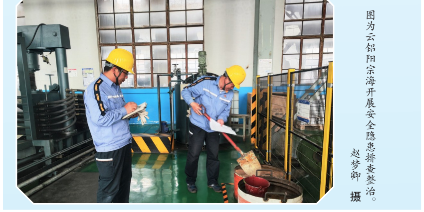
图为云铝铝宗海开展安全隐患排查整治。