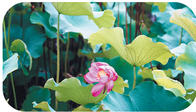
莲洁 东南铝业