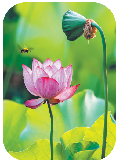
迷恋 九冶 徐鹏 摄