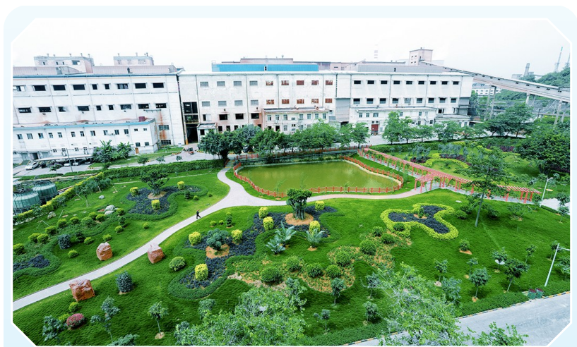
▲ 图为中铝股份广西分公司厂区。 ▶ 图为中铝股份广西分公司矿业公司浓缩絮凝剂槽。

绿色工厂，绿化先行。中铝股份广西分公司高度重视环境保护工作，绿化环卫团队精心呵护每一片绿叶，绿化率