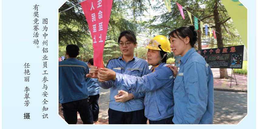
有奖竞赛活动 图为中州铝业员工参与安全知识