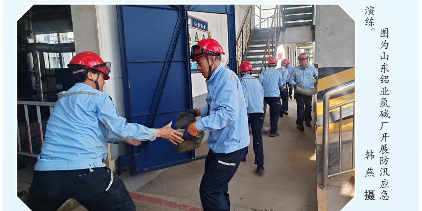
演练 图为山东铝业氯碱厂开展防汛应急演练。

本报讯 连日来，中铝集团各单位围绕“人人讲安全 个个会应急——畅通生命通道”主题，积极开展“安全生产月”系列活动，通过开展安全生产应急演练、安全知识有奖竞赛、安全隐患排查整治等形式，全面提升员工安全意识和能力素养，为企业安全生产奠定坚实基础。