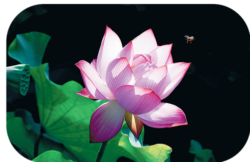
盛夏光影